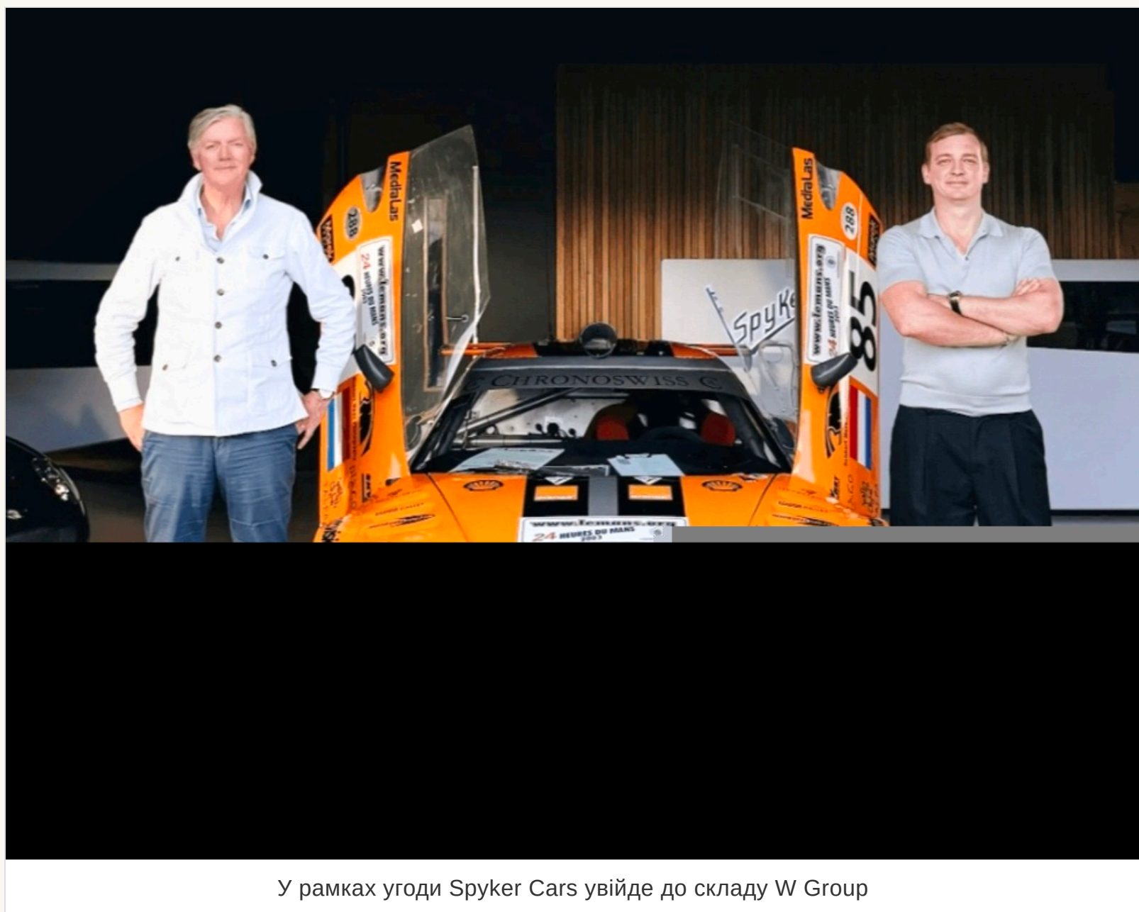
У рамках угоди Spyker Cars увійде до складу W Group

Збирання C8 Preliator заплановано у Великій Британії, фарбування та фінальне збирання — у Нідерландах.