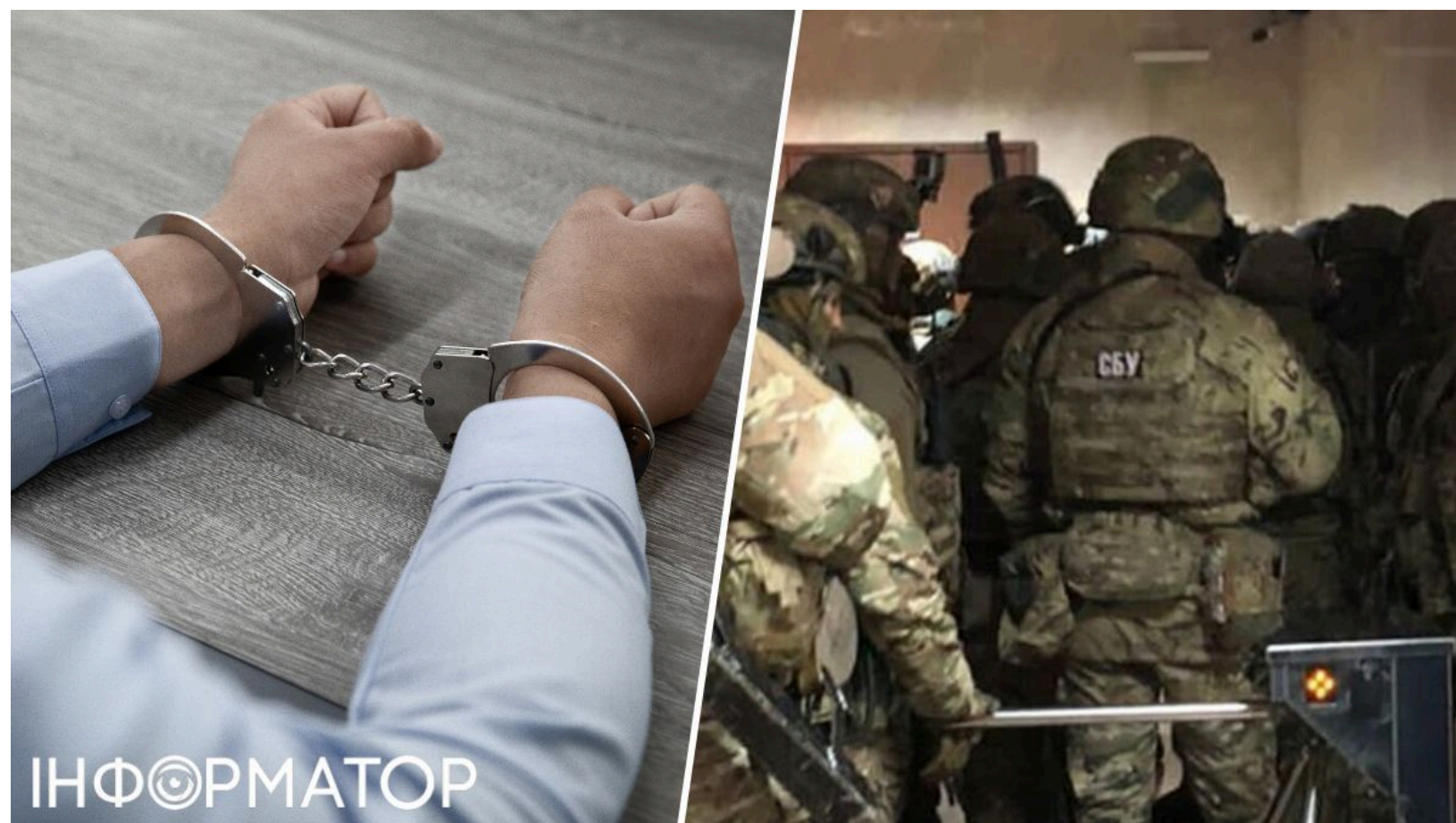
Вирок чиновнику-агенту ФСБ із Сумщини

Колишній заступник голови місцевої громади на Сумщині, який шпигував на користь Росії, отримав 15 років ув'язнення з конфіскацією майна. ФСБ вербує агентів в Україні різними методами - нещодавно викрили офіцера ГРУ, який для диверсій в Одесі залучав неповнолітніх. Чиновника із Сумщини завербували ще до початку повномасштабного вторгнення, а під час війни він передавав ворогу геолокації українських підрозділів. Щоб приховати виїзд до Росії та зустріч із куратором, він вигадав легенду про власний "полон".