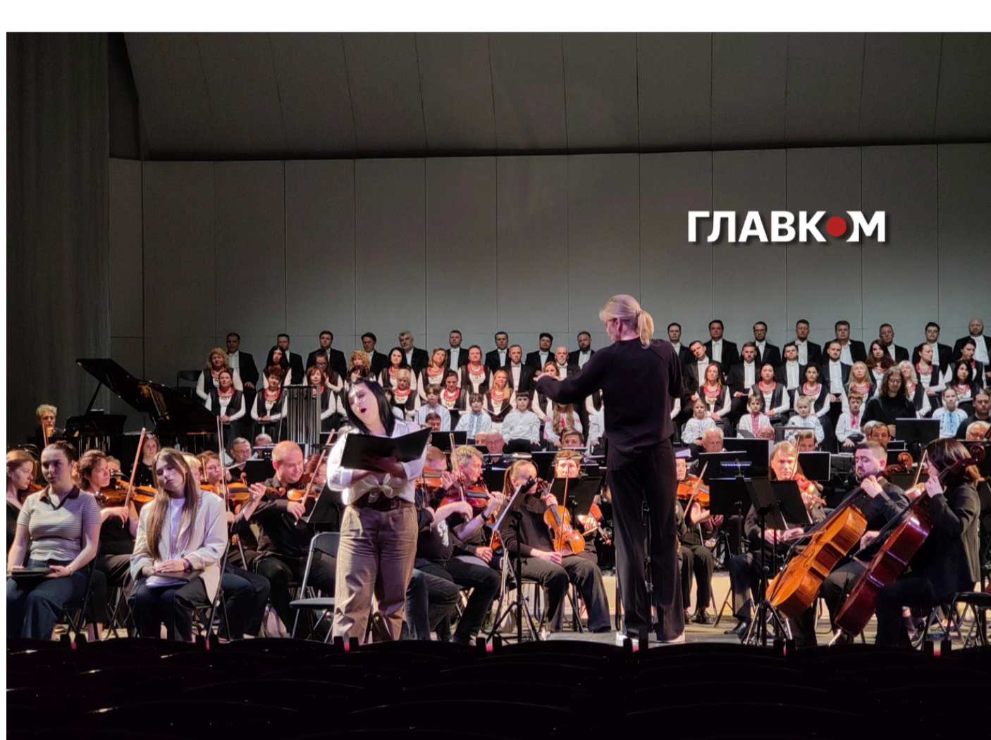
Національна опера представила концертну версію опери «Матері Херсона»

Сама постановка ще допрацьовується. На пресбрифінгу після генеральної репетиції концертної версії опери в Національній опері пролунала критика щодо самого лібрето, написаного американцем Джорджем Брантом. Так, у початковій версії твору хор співає: «Херсон захоплено! Це місто вже не наше». Культурологиня Зоя Звизняцька звернула увагу , що ця фраза не відображає справжні настрої херсонців, які мужньо чинили спротив окупації. Творча команда дослухалася до зауваження та змінила текст на «Херсон захоплено, та місто завжди буде нашим!»