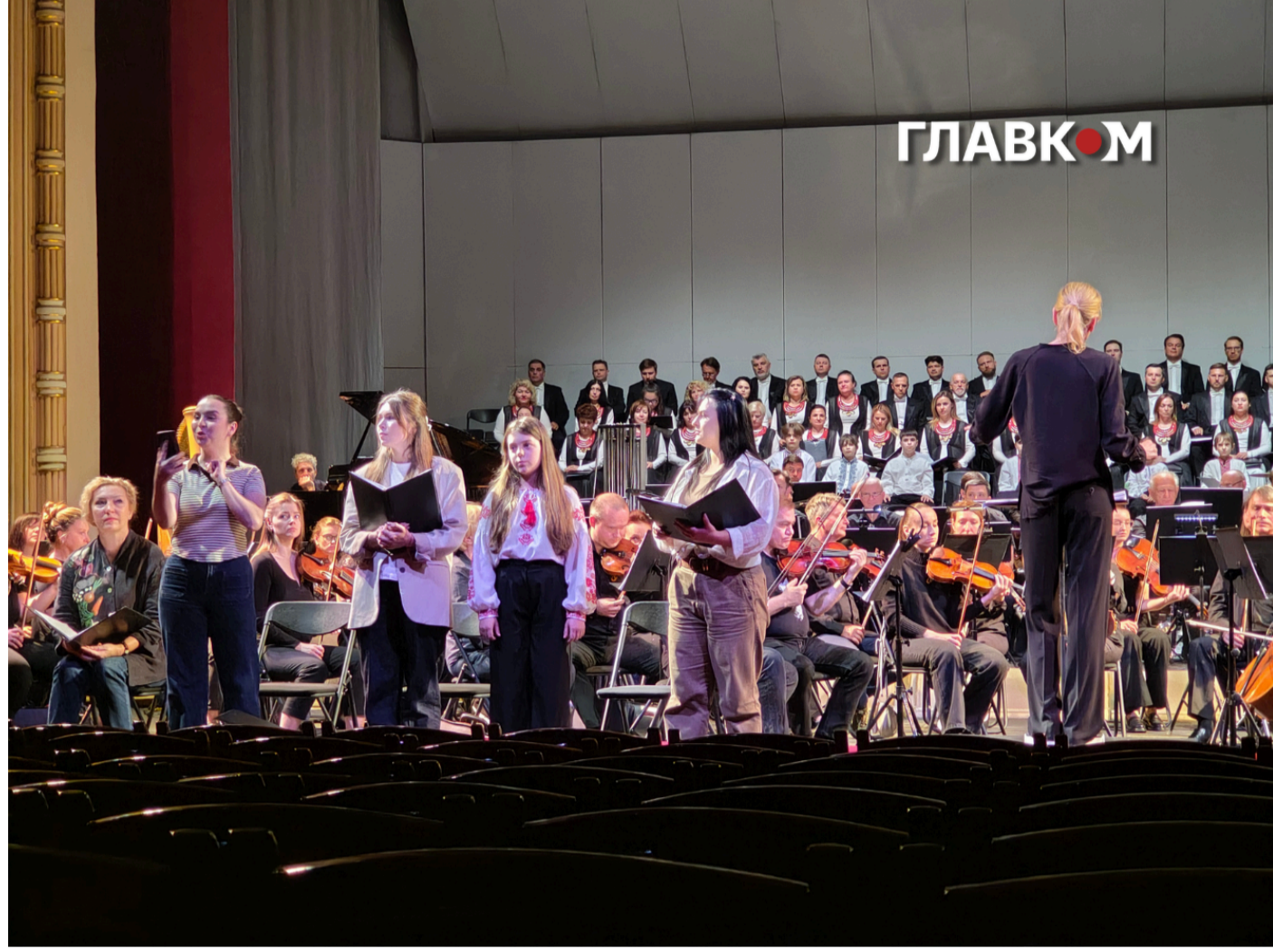
Опера «Матері Херсона» розповідає історію двох матерів та бабусі з Херсона, які вирушають у подорож дожиною понад чотири тисячі кілометрів через кілька країн і підконтрольні Росії території, щоб врятувати своїх дочок, яких окупанти утримують у Криму

Композитором опери є українець Максим Коломієць. У 2022 році Держмістєцтєв спільно з Міністерством культури України провели конкурс на написання опери і з поміж 74 заявників Метрополітен-опера обрала для створення твору саме Коломійця, у творчому доробку якого вже є дві опери – «Есепвіаіт та «Ніч». У «Матерях Херсона» композитор активно використовує український фольклор та традиції національного мелосу, зокрема колискові та народні пісні.