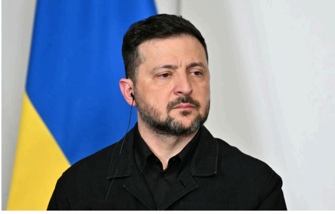
Президент України Володимир Зеленський

🔍 Не витрачай час на шум! Читай тільки суть з РБК-Україна у Google