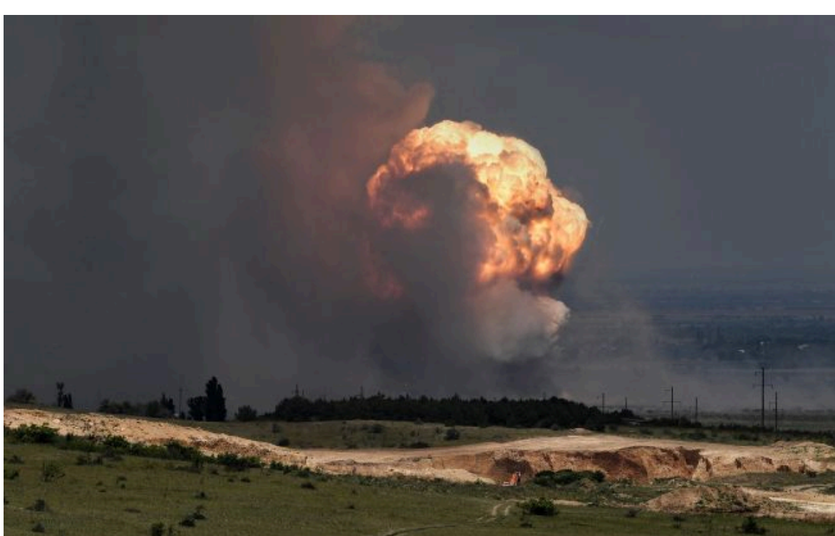
Фото ілюстративне: ЗСУ оприлюднили кадри ліквідації логістичного шляху ворога в Армянську