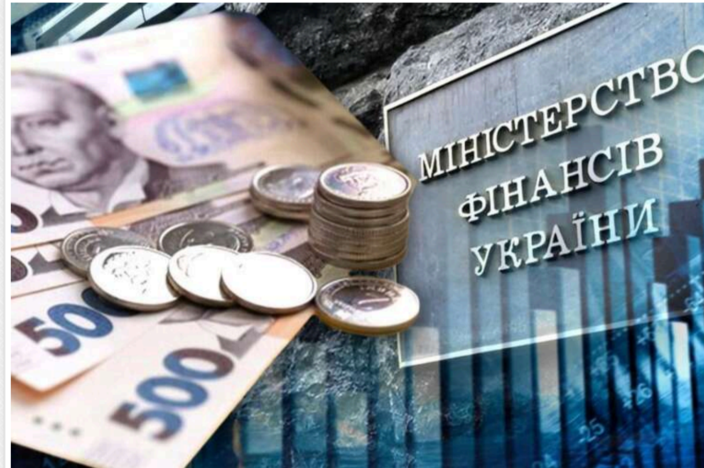
Бюджетний дефіцит у трильйон гривень може виникнути вже наступного року навіть за оптимістичного сценарію, - ЗМІ

Читати на руськом Read in English Додати як бажане джерело в Google