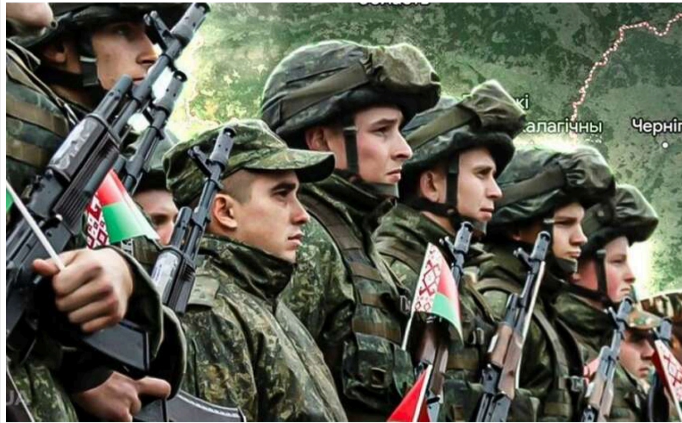
Чи вступить Білорусь у війну РФ проти України: в Sky News сумніваються в боєздатності армії Лукашенка

Білорусь, будучи головним союзником Кремля, з самого початку вторгнення фактично стала співучасником агресії – надавши свою територію для атаки на Україну й залющивши очі на участь білорусів у боях на боці РФ. Однак питання про пряму участь Мінська у війні залишається відкритим.