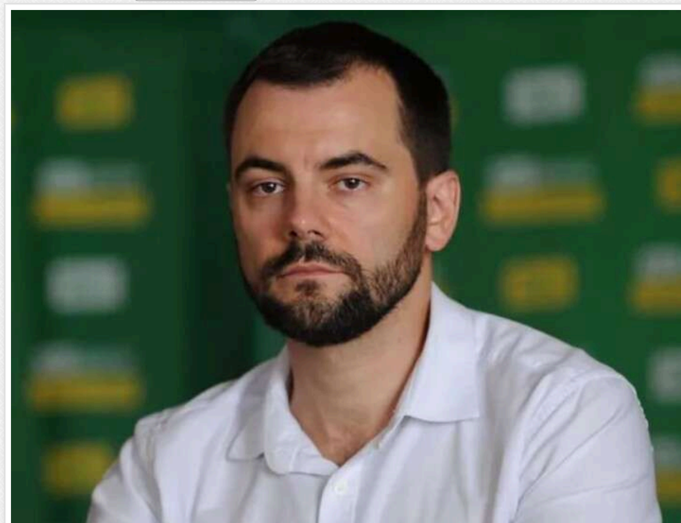
Нардеп Маріковський заробить на моніторингу ЗМІ в 2025 році на 4 мільйони гривень більше через подорожчання послуг «Медіатеки» без пояснень

Читати на руськом Додати як бажане джерело в Google