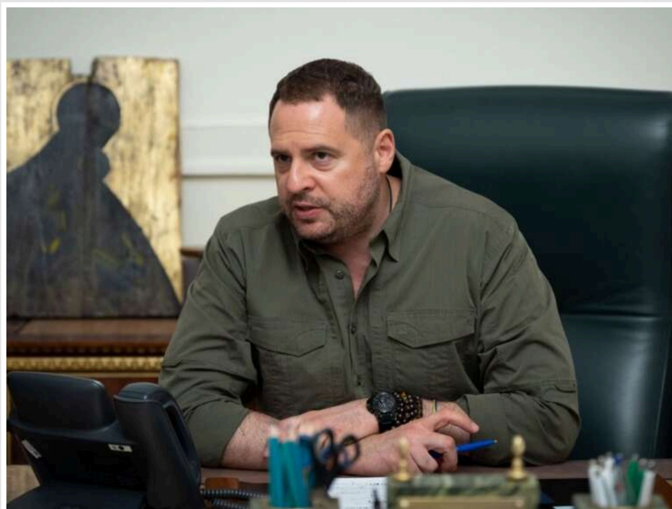
Politico: Андрій Єрмак – тіньовий політичний гравець з впливом, порівнянним із Зеленським, та амбіціями на президентство

Читати на руськом Додати як бажане джерело в Google