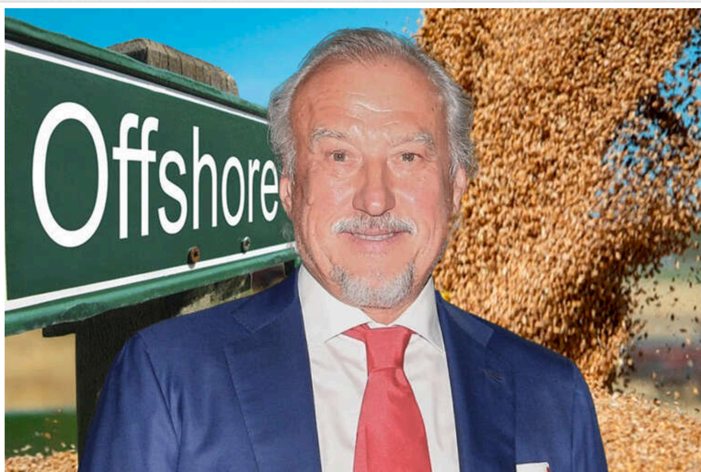
Відмивання мільйонів доларів, офшори та Осьмачко: як українське зерно годує підсанкційного російського олігарха Федоричева

Читати на руськом Read in English Додати як бажане джерело в Google