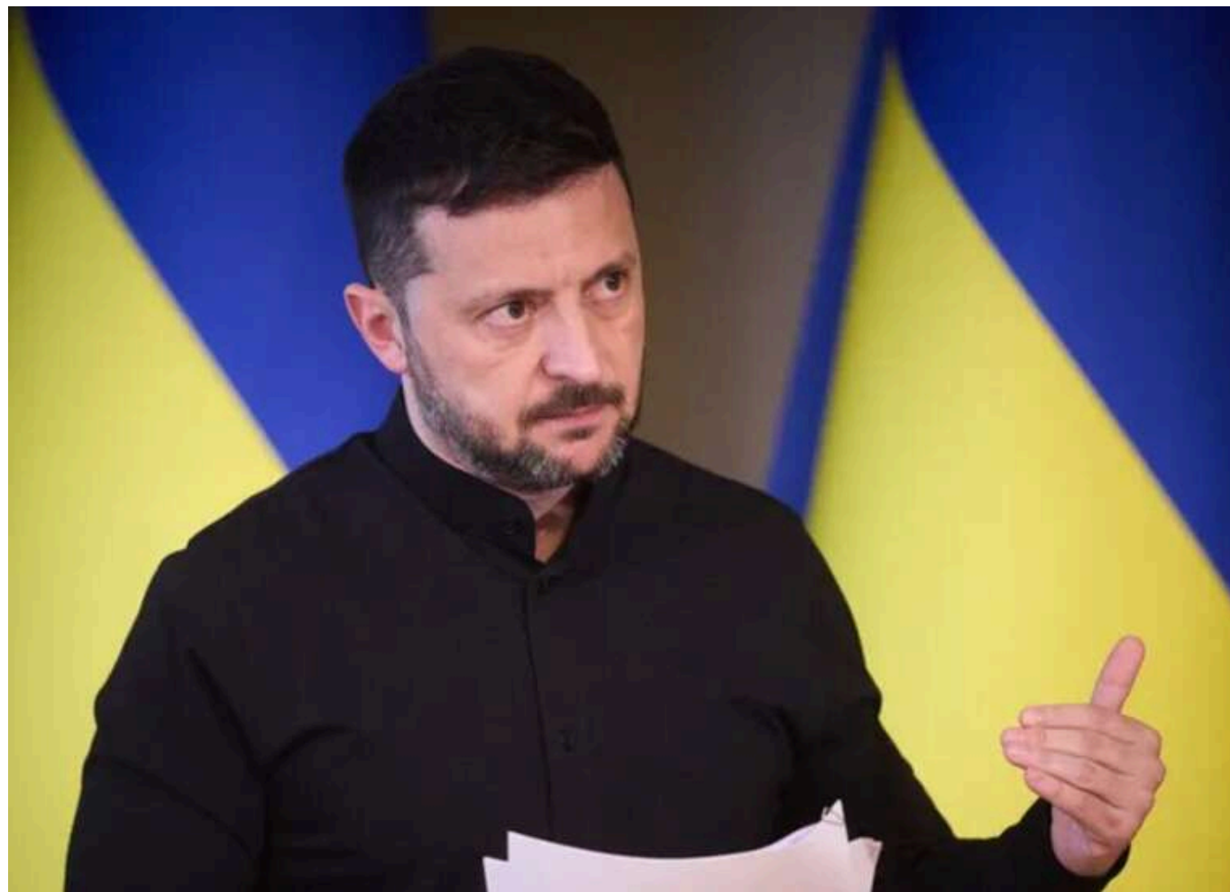
Зеленський закликає використовувати заморожені російські активи для фінансування армії України. Мерц підтверджує підтримку на рівні G7

Читати на руськом Read in English Додати як бажане джерело в Google