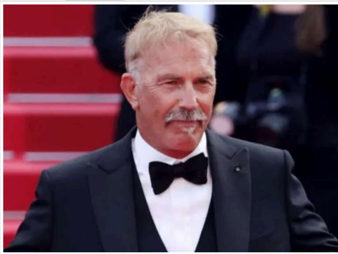
На 70-річного Кевіна Костнера було подано до суду у зв'язку з інцидентом на знімальному майданчику

Американського актора та 70-річного режисера Кевіна Костнера, відомого за фільмами "Пілохоронець", "Той, що танцює з вовками" і серіалом "Слостоун", звинувачують у зрубому порушенні стандартів безпеки під час зйомок другого фільму серії "Горизонт: Американська сага" (2024). Каскадерка Девін Лабелла подала на Костнера та продюсерів фільму до суду, заявивши про примус до участі в імпровізованій сцені сексуального насильства без попередження, згоди та належного супроводу.