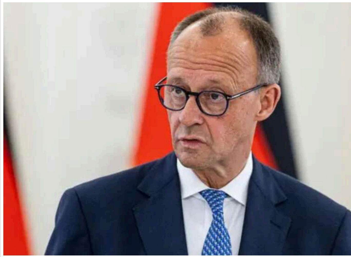
Масовані атаки Росії свідчать не про мир, а про бажання виграти час, - Мерц

Читати на руськом Read in English Додати як бажане джерело в Google