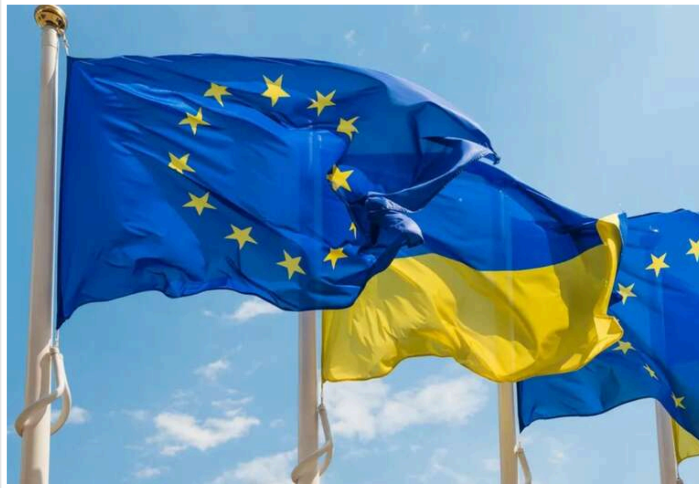
59% європейців підтримують закупівлю і постачання зброї Україні, - опитування

Читати на руськом Read in English Додати як бажане джерело в Google