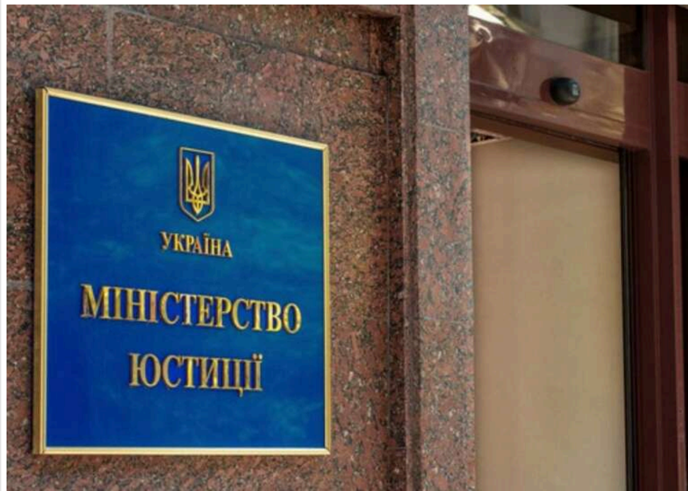
Україна встановила кінцевий термін для скасування «поправок Лозового» з метою вступу до ЄС, - Мін'юст

Читати на руськом Read in English Додати як бажане джерело в Google