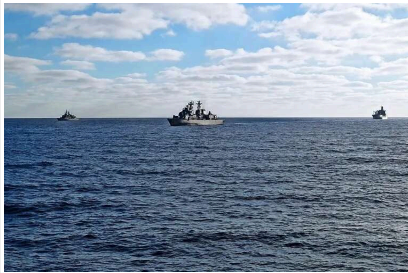
Європейський Союз представив нову стратегію для Чорного моря

Європейський Союз представив нову стратегію, орієнтовану на забезпечення стабільності та безпеки в Чорноморському регіоні.