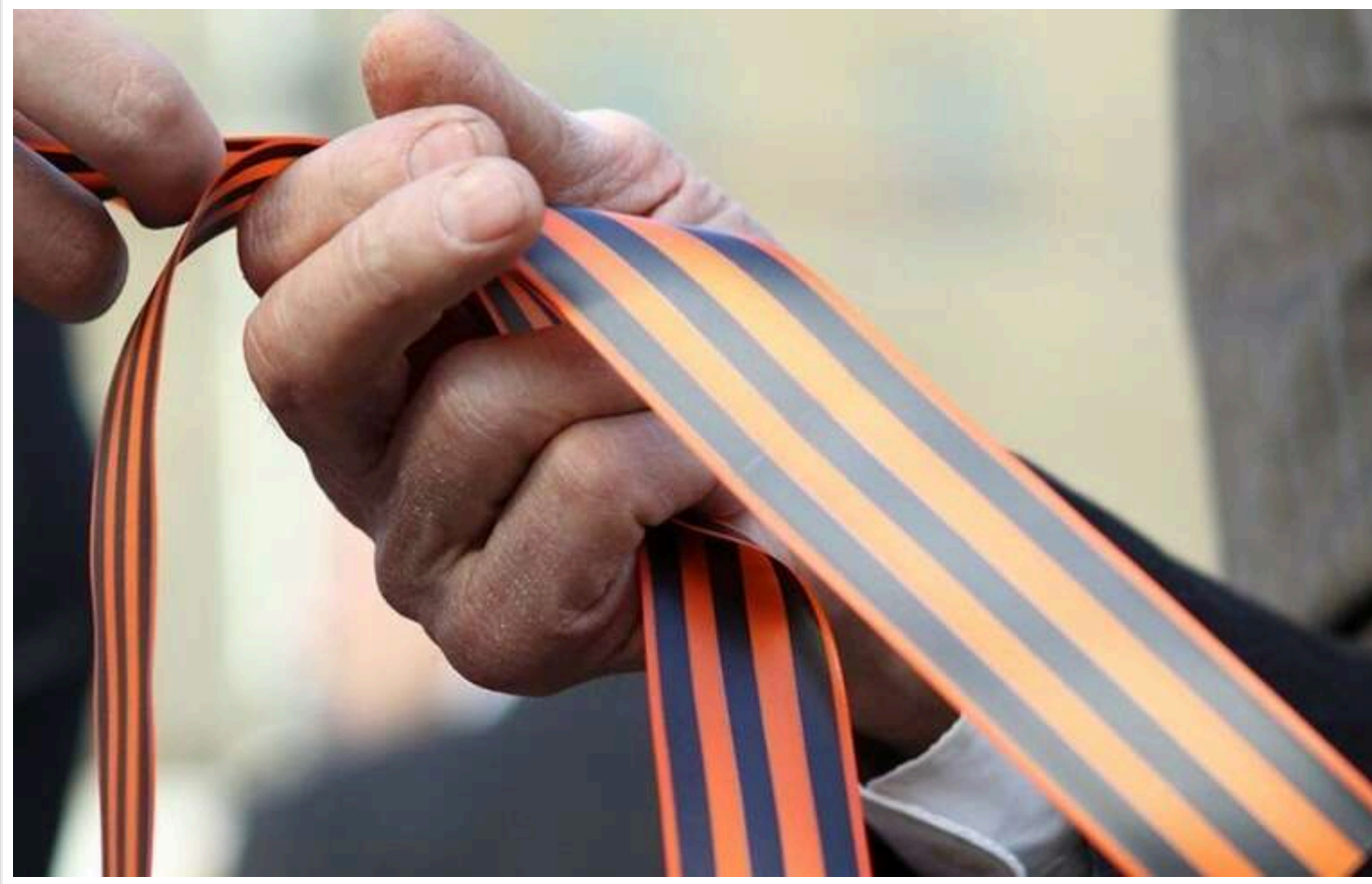
У Молдові сімом депутатам може загрозувати штраф за георгіївську стрічку 9 травня

Сім депутатів парламенту Молдови можуть отримати штраф за використання георгіївської стрічки під час заходів, присвячених 9 травня.