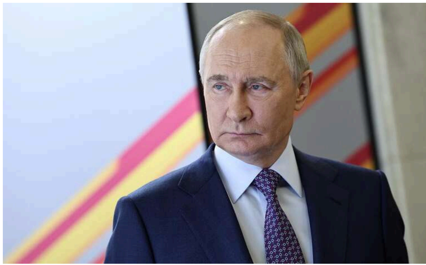
Путін наполягає, щоб Захід надав письмове зобов'язання не розширювати НАТО на схід і зняв санкції з РФ - Reuters

Російський диктатор Володимир Путін вимагає від західних лідерів надати письмові зобов'язання припинити розширення НАТО на схід і зняти частину санкцій із Росії для завершення війни в Україні, пише агентство Reuters з посиланням на три російські джерела в середу, 28 травня.