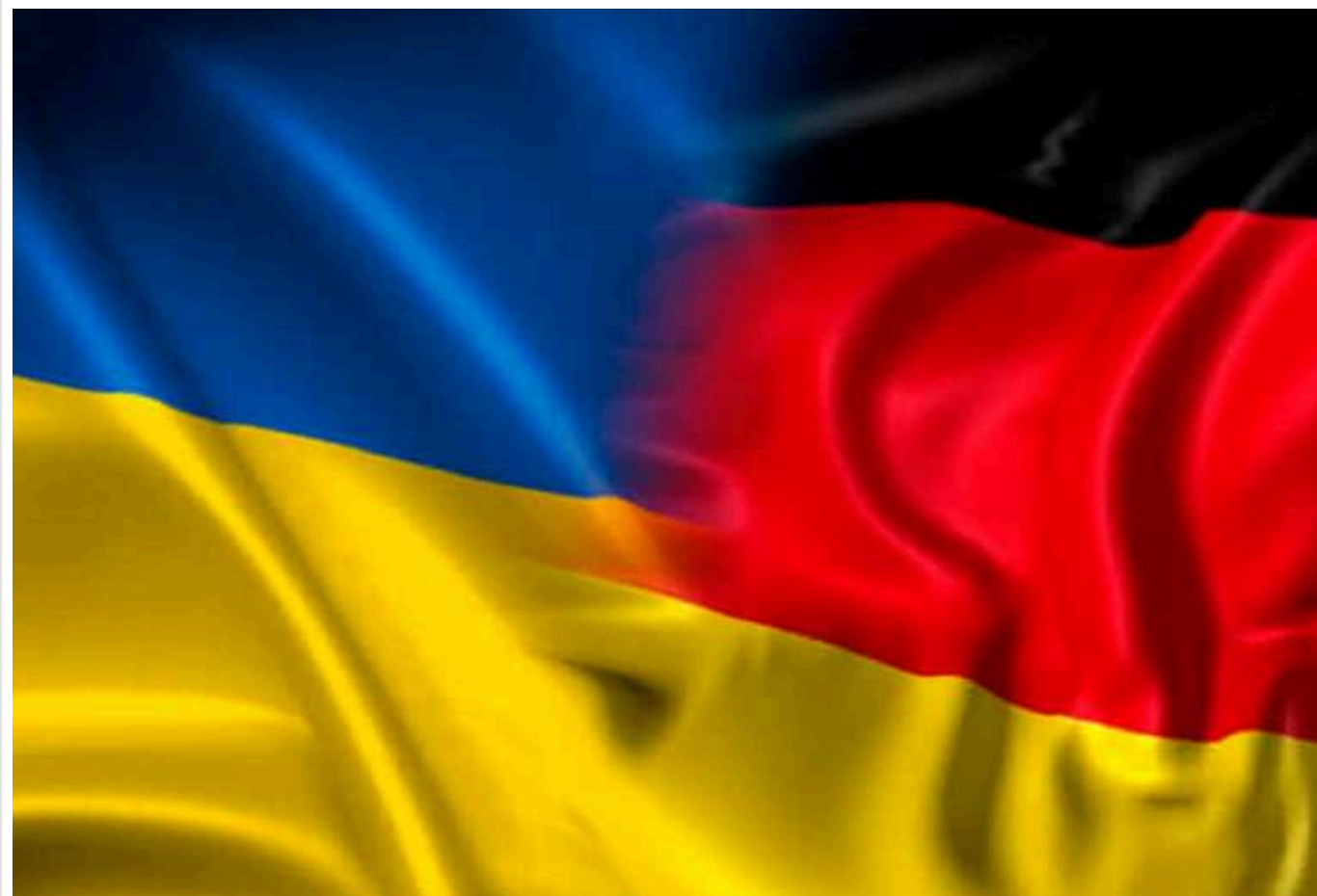
Німеччина сприйтиме Україні в розробці власних крилатих ракет із дальністю до 2500 кілометрів, - BILD

Уряд Німеччини планує надати українському ВПК мільйони євро для самостійної розробки та масового виробництва крилатих ракет з дальністю польоту до 2500 кілометрів, пише BILD із посиланням на свої джерела.