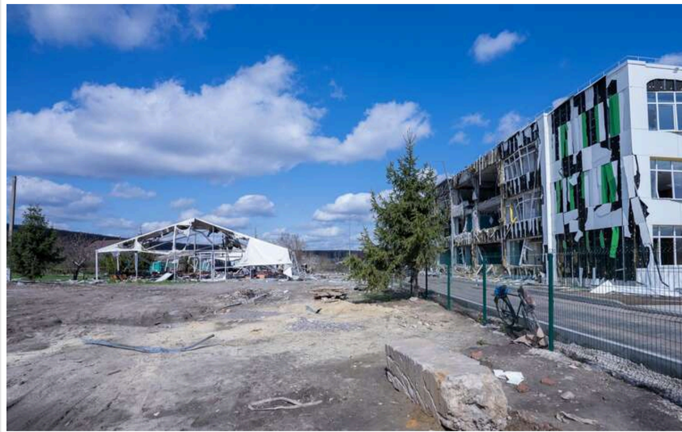
Бомбосховище за 145 мільйонів для ліцею-примари: у Харківській області будуть укриття для школи, якої вже немає

Харківщина: 145 мільйонів на бомбосховище – для школи, якої фактично вже немає.