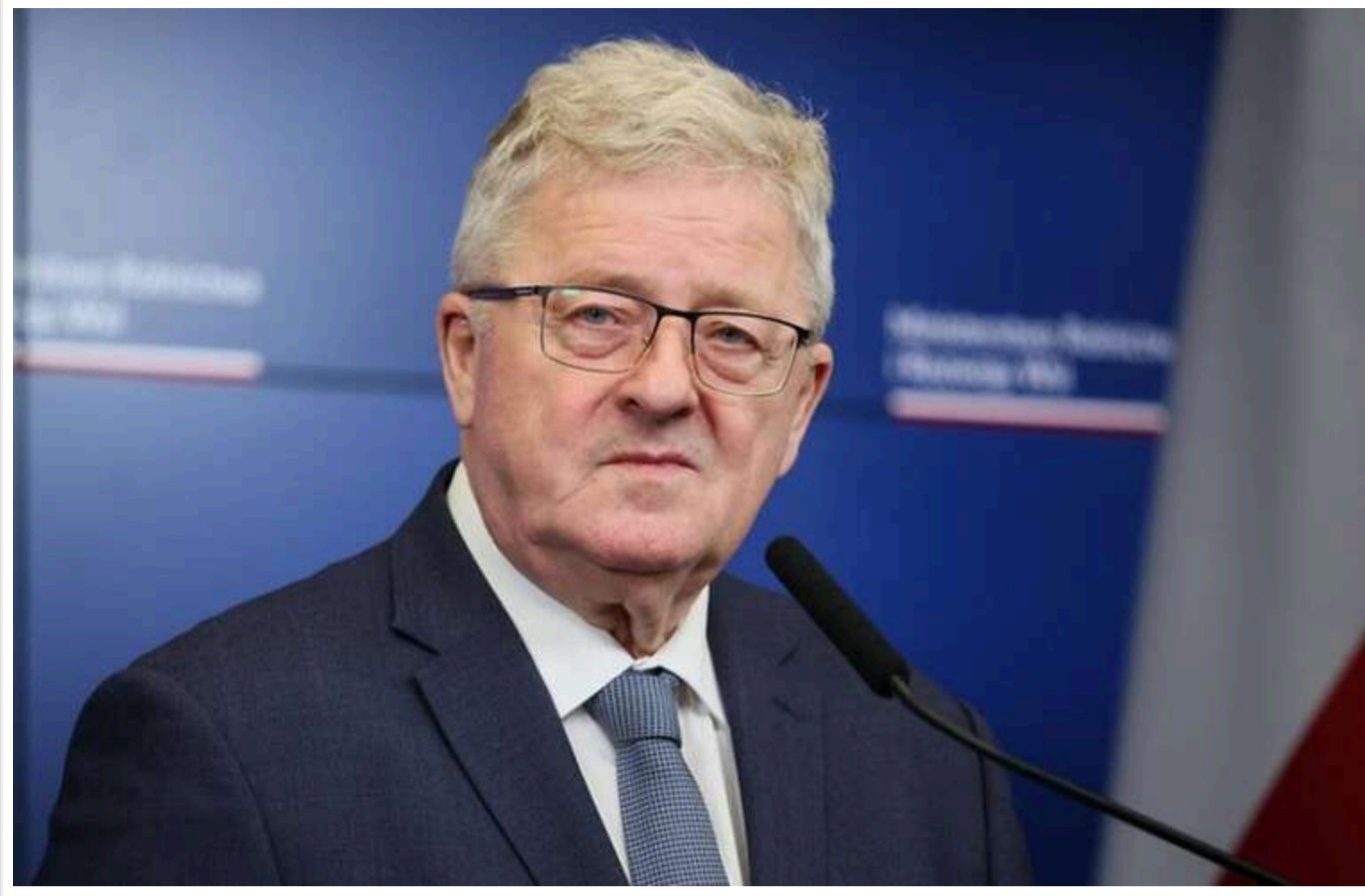
У Польщі задоволені скасуванням «торгового безвізу» для України

Польща задоволена скасуванням «торгового безвізу» для України, заявив міністр сільського господарства Польщі Чеслав Секерський.