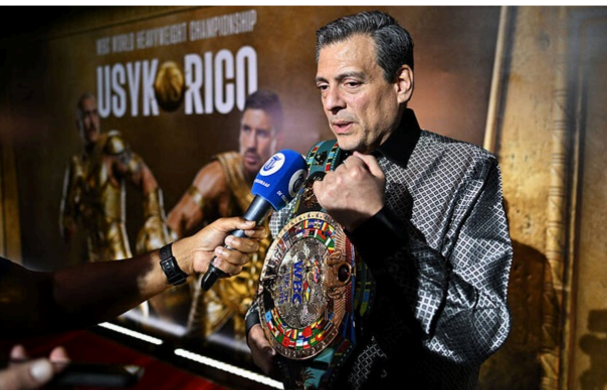
Mauricio Сулейман

Сулейман підтвердив активацію спеціального пункту регламенту, який є обов'язковим для виконання українським чемпіоном.