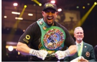
Джошуа поставив на Кабелла у поєдинку проти Усика 9 червня 2026, 10:13

Новини від Кореспондент.net в Telegram та WhatsApp. Підписуйтесь на наші канали https://t.me/korrespondentnet та WhatsApp