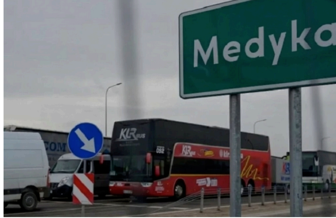
Пасажирські автобуси через КПП "Шегині – Медика" влітку їздитимуть без обмежень

Автобусний рух через пункт пропуску "Медика – Шегині" у напрямку Польщі працюватиме влітку без обмежень. Польща погодилася відтермінувати обмеження руху, які мали тривати 18 місяців.