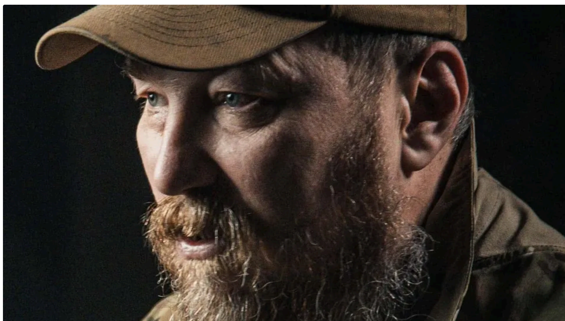
За словами Мадяра, ураження одного військового коштує менше ніж $1 тис.

11 червня, 21.09 🔒 Цей матеріал також можна прочитати на руском