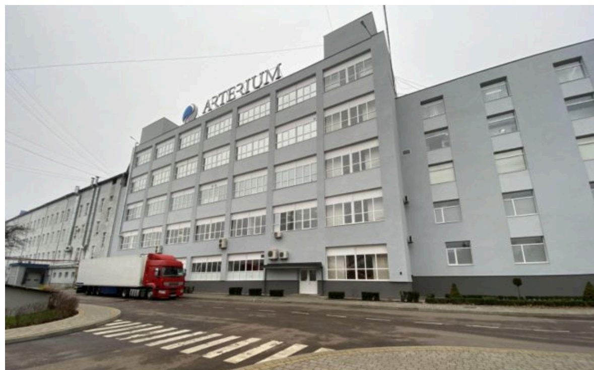
Родина Жеваго отримала відмову суду Англії у справі "Артеріуму"