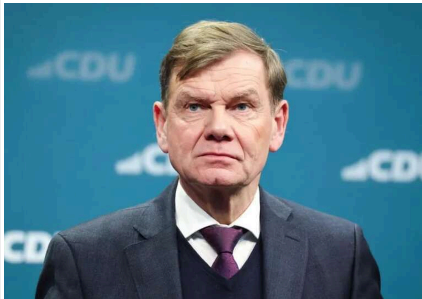
Путін не прагне миру: відповідь на ініціативи України – лише ракети й дрони, - Вадефул

Президент Росії Володимир Путін не прагне до миру. Останні масштабні атаки на Україну – свідчення цього.