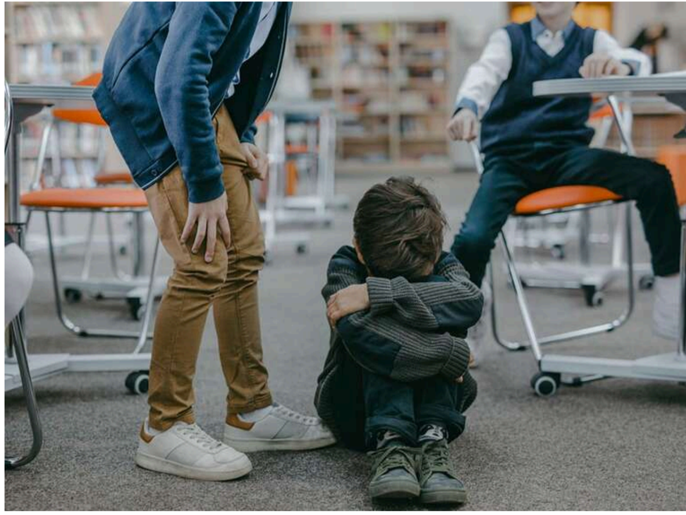
Кількість скарг на булінг у школах за рік збільшилася майже втричі, - Лубінець

Читати на русском Read in English Додати як бажане джерело в Google