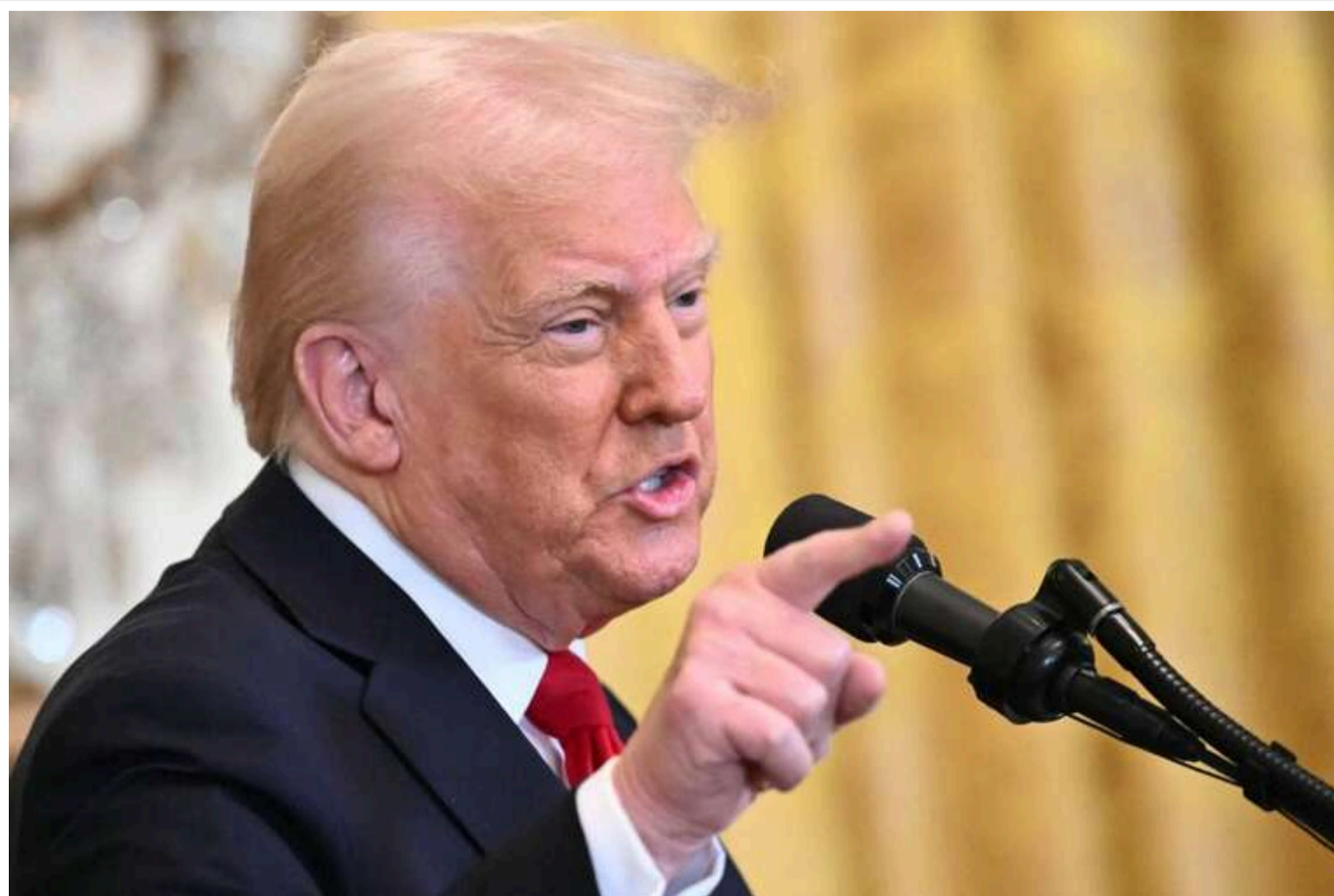
Трамп розглядає запровадження санкцій проти Росії вже цього тижня, - WSJ

Трамп розглядає можливість запровадження санкцій проти Росії вже цього тижня.