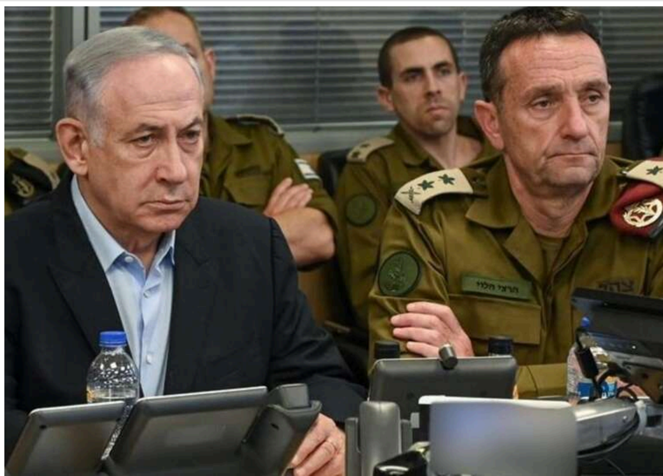
Ізраїль не прийняв останню версію мирної угоди з ХАМАС, - ЗМІ

Ізраїльська сторона спростувала інформацію про начебто принципову згоду Єрусалима на новий план щодо угоди про звільнення заручників і припинення вогню в Секторі Гази.