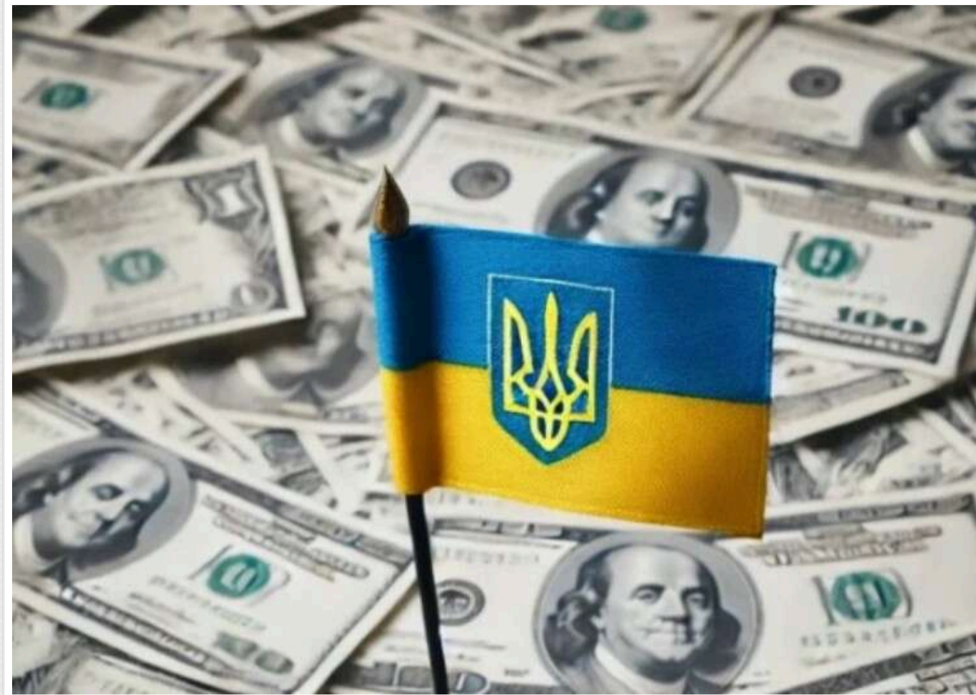
Держборг України у квітні збільшився на 5%, сягнувши 180 мільярдів доларів

На 30 квітня 2025 року державний та гарантований державою борг України становив 7 480,3 млрд грн, що еквівалентно 180 млрд доларів США.