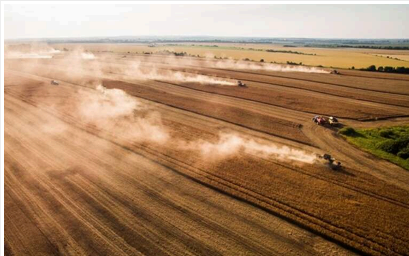
Сірі королі агроекспорту: як Малиновський, Козир і Пуля обкрадають бюджет України через тіньові схеми

Читати на руськом Read in English Додати як бажане джерело в Google