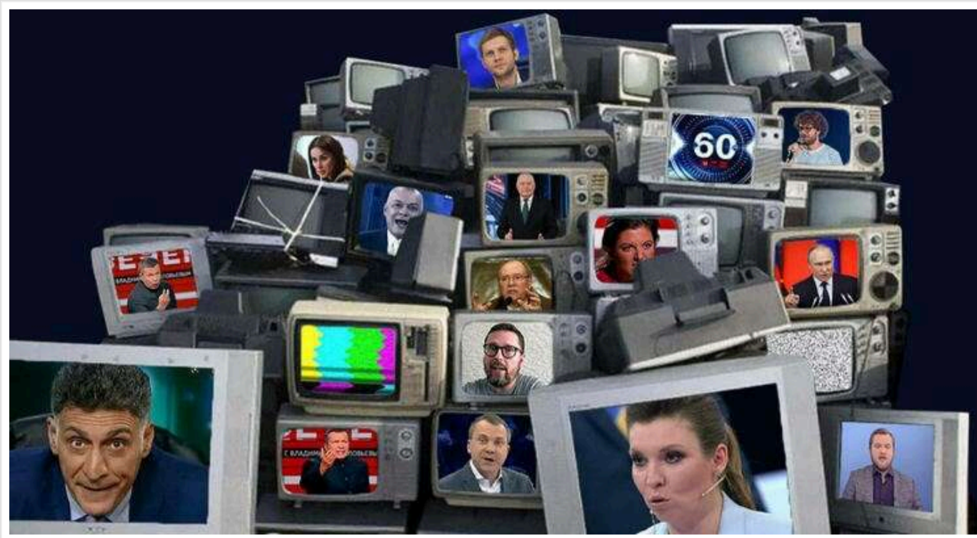
Пропаганда замість армії: як Кремль використовує українських полонених для інформаційної війни

Читати на руськом Read in English Додати як бажане джерело в Google