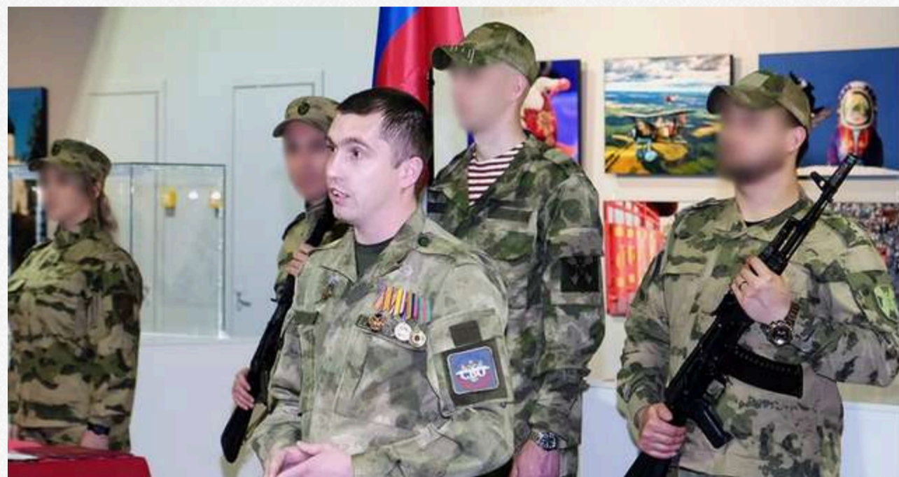
Мобілізовані москвитами українці Мелітополя (весна 2025 року)

Всім цим підрозділам притаманне одне: маніпуляція, примус, публічні ролики під диктат і відсутність реальної довіри навіть серед російських ЗМІ, а потім – повне зникнення з інформаційного поля. Батальйон Богдана Хмельницького взагалі розпустили по домах через побоювання, що там почнуть стріляти у спину москвитам.