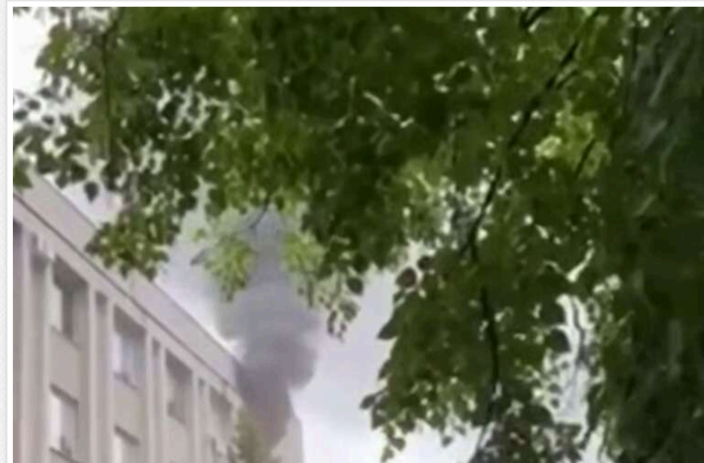
У Вінниці горить ТЦК: обставини пожежі невідомі