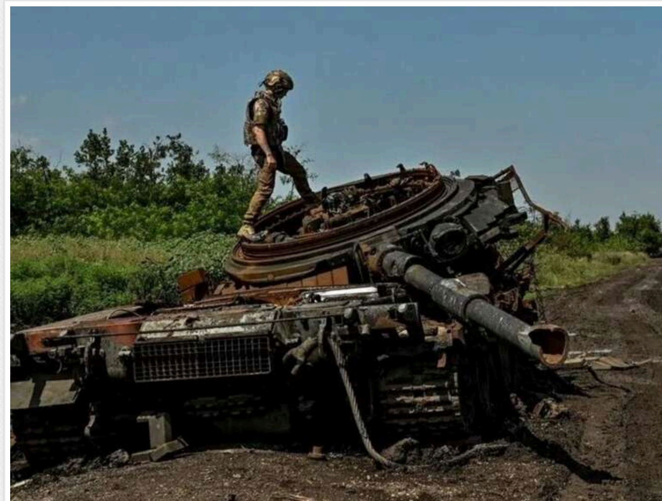
Втрати ворога за добу: ЗСУ відмінували 1000 окупантів

Читати на руском Read in English Додати як бажане джерело в Google