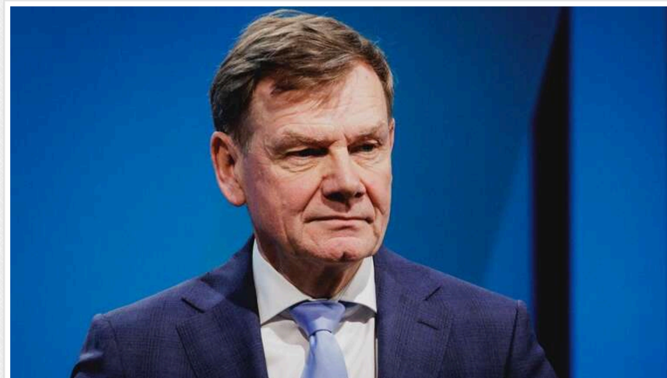
В МЗС Німеччини нагадали, що Путін не хоче миру

Голова МЗС Німеччини Йоганн Вадефуль заявив, що останні масовані обстріли української території з боку Росії є прямим викликом політичному Заходу та особистою образою для президента США Дональда Трампа.