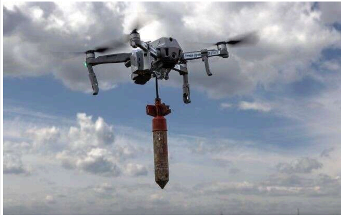
Окупанти масово використовують дрони на оптоволоконні в контратаках, - офіцер ЗСУ

Читати на руском Read in English Додати як бажане джерело в Google