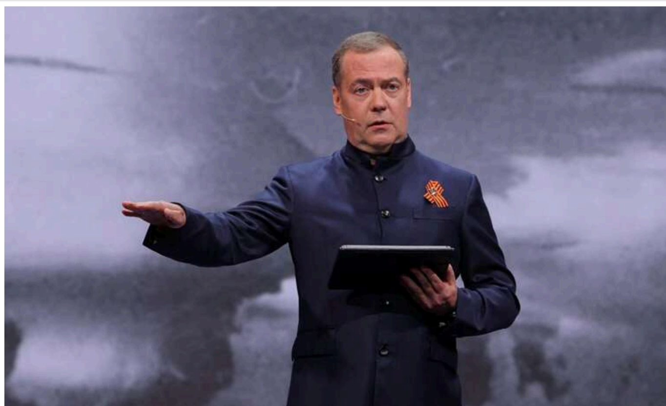
ISW: Ціна "буферної зони" Медведєва - 91 рік війни і третина населення Росії

Створення озвученої Медведєвим "буферної зони" виглядає як кривава фантазія без шансу на успіх. У росіян практично немає шансів захопити всю Україну.