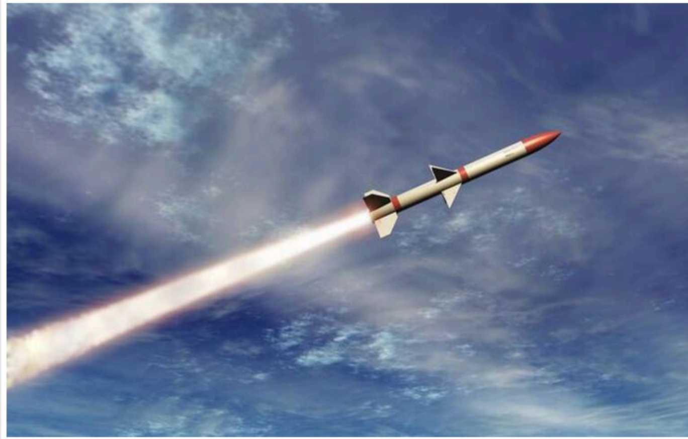
Вночі РФ запустила по Україні ракети з Ту-95МС і дрони: під основним ударом був Старокостянтинів

Країна-агресорка Росія вранці 26 травня підняла в небо військову авіацію, зокрема стратегічні бомбардувальники Ту-95МС, які зазвичай здійснюють обстріли України. Згодом ворог запустив крилаті ракети.