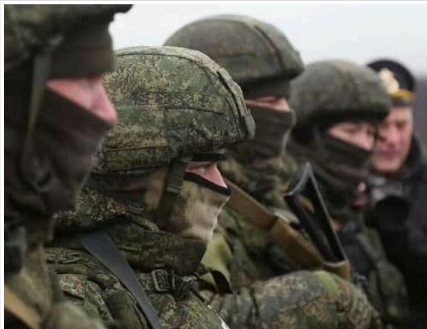
Росія готує нову хвилю мобілізації: у планах – ще 300 тисяч строковиків

Росія продовжує накопичувати військовий потенціал і готується до подальшого наступу на території України.