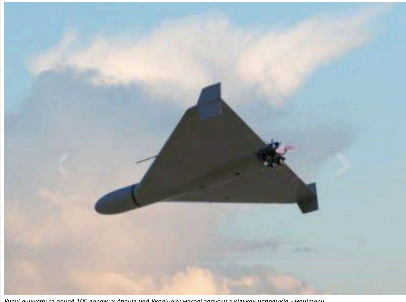
Уночі очікується понад 100 ворожих дронів над Україною: масові запуски з кількох напрямків, - монітори

У ніч проти 26 травня над Україною очікується масштабна повітряна атака: моніторингові ресурси повідомляють про запуск понад 100 дронів-камікадзе типу "Shahed" із території Росії.