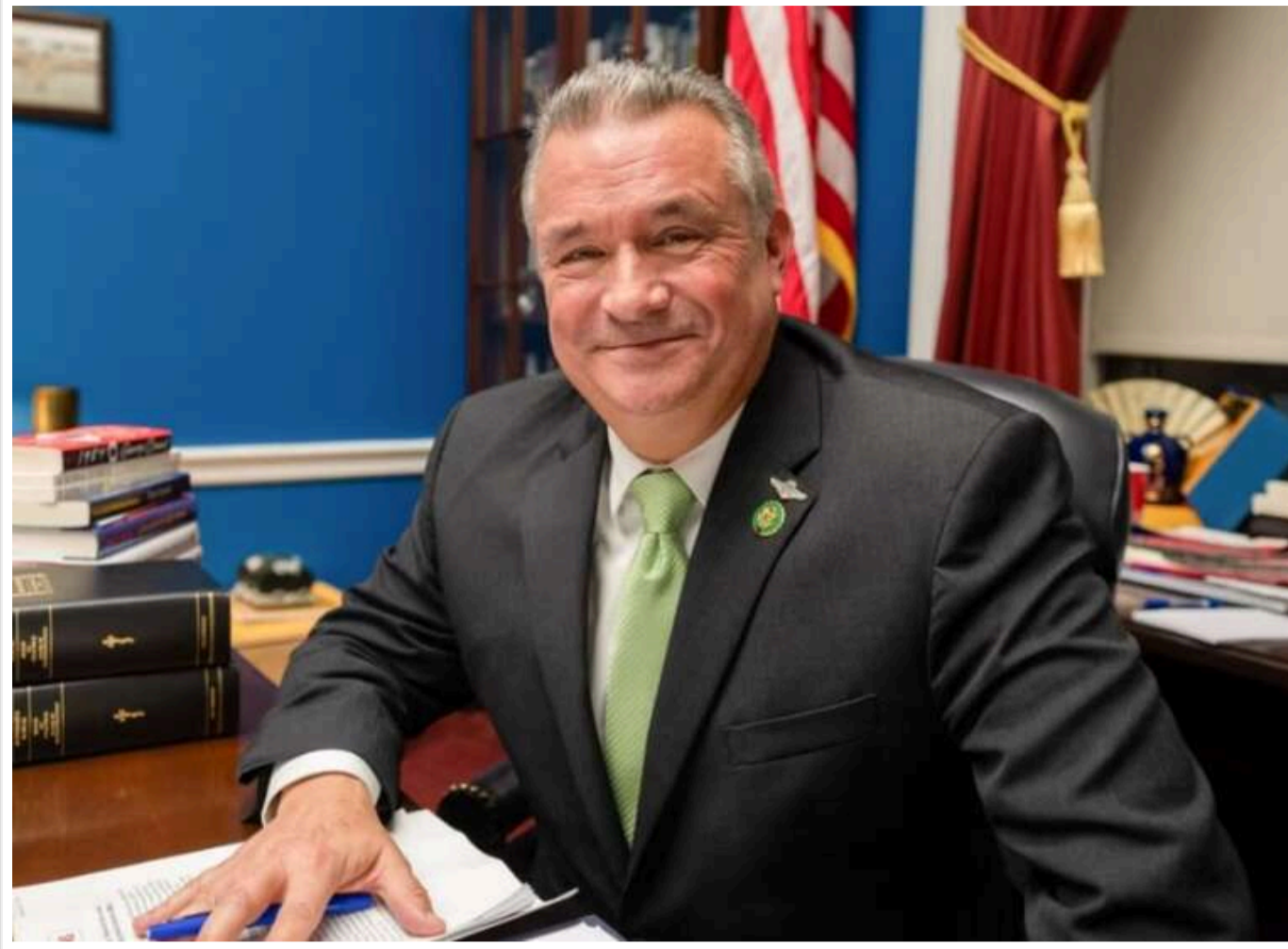
Україну слід озброїти до зубів, активи РФ – конфіскувати, - республіканець Дон Бейкон

Член Палати представників, поміркований республіканець Дон Бейкон після масованих обстрілів Росією України у ці вихідні відкинув ідею мирних переговорів із РФ та закликав до рішучих кроків.