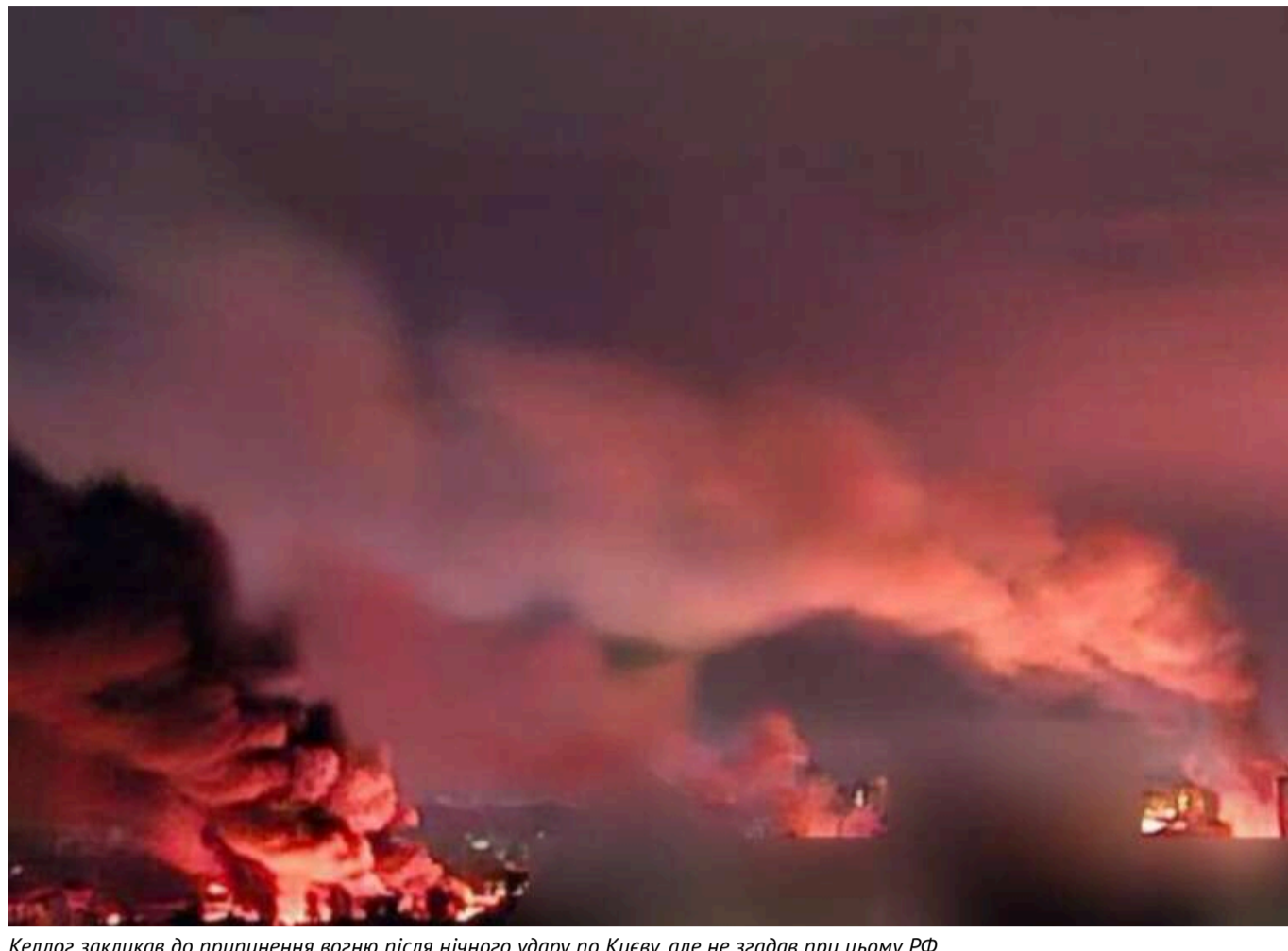
Келлог закликав до припинення вогню після нічного удару по Києву, але не згадав при цьому РФ

Кіт Келлог відреагував на чергову ракетну атаку по Києву, оприлюднивши у соціальних мережах фото наслідків ударів.