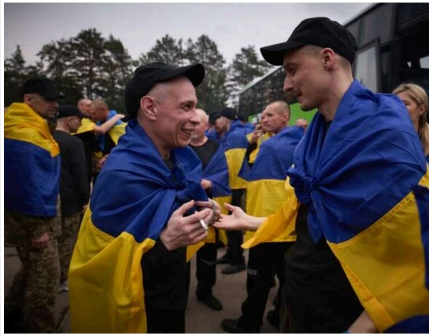
ГУР Міноборони пояснило відсутність бійців «Азова» в обміні полоненими: рішення ухвалювала Росія

Читати на руськом Read in English Додати як бажане джерело в Google