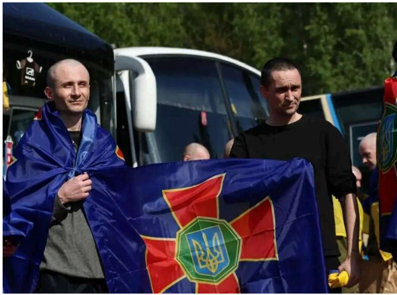
Україна вже займається підготовкою наступних обмінів полоненими, - Юсов

Після великого обміну, в ході якого додому повернулися 1000 українських захисників, країна вже готується до наступних операцій.