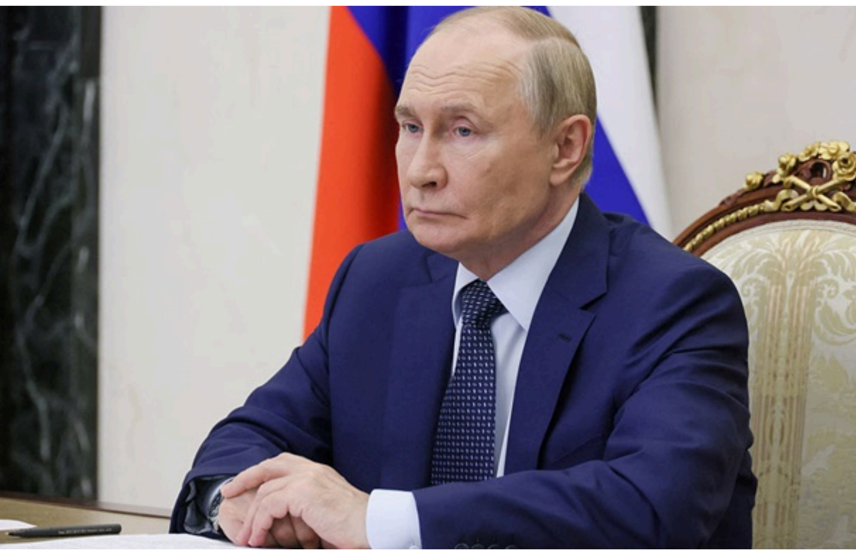
Володимиру Путіну доведеться у якийсь момент вирішити суперечку

Адміністрація Путін побоюється, що масові блокування інтернету можуть викликати невдоволення населення напередодні парламентських виборів. Тим часом, сам Путін так і не дав пояснення, навіщо потрібні масштабні відключення.