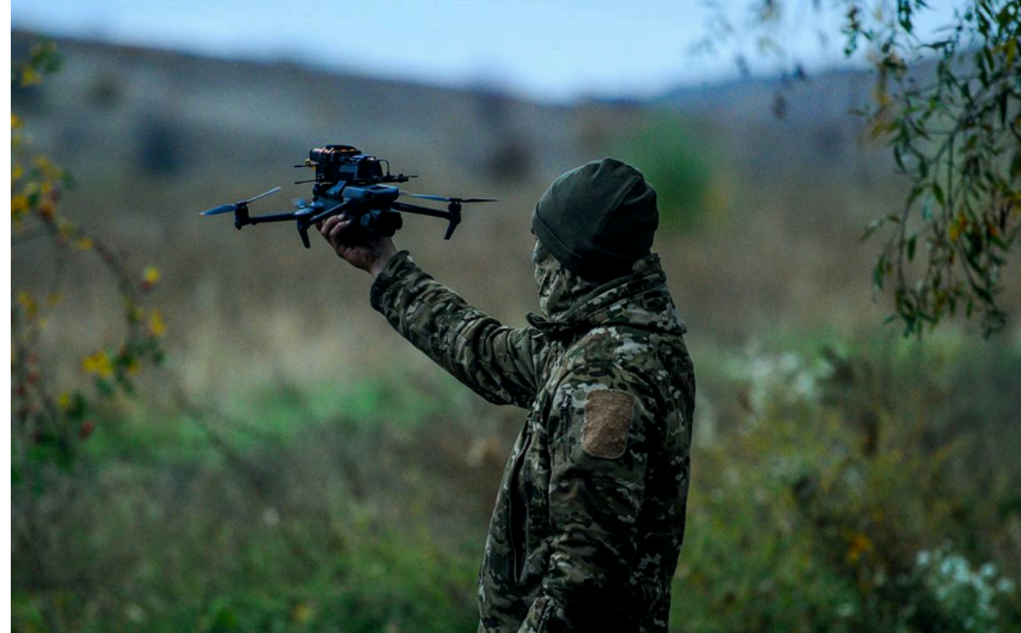
Закупівлю дронів здійснюватимуть через тендери / Сухопутні війська ЗСУ

Міноборони планує перевести всі оборонні закупівлі на електронні тендери до кінця літа 2026 року. Головна мета масштабної цифровізації – посилити конкуренцію серед виробників, знизити закупівельні ціни на техніку та повністю прибрати людський фактор для подолання корупційних ризиків