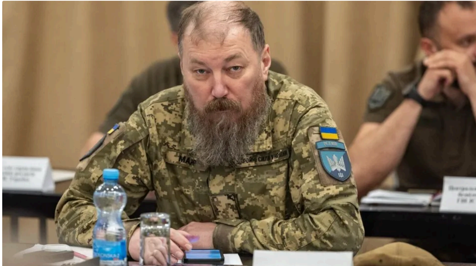
Бровді прогнозує повний контроль над трасою "Новоросія" та ізоляцію Криму

11 червня, 19:35 🗨️ Этот материал также можно прочитать на русском