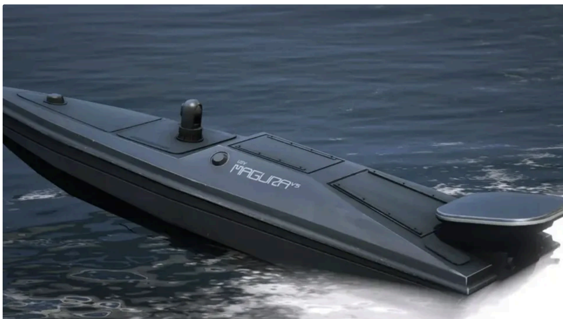
Румунія просить Україну про самознищення морських дронів

Угорщина пропонує Україні запрограмувати свої безпілотники таким чином, щоб вони самознищувалися у разі наближення до румунського узбережжя Чорного моря. Про це заявив виконувач обов'язків міністра оборони Раду Міруце в інтерв'ю TVR Info, яке опублікували 11 червня.