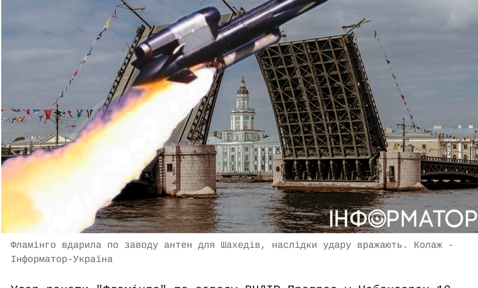
Фламінго вдарила по заводу антен для Шахедів, наслідки удару вражають.

Удар ракети "Фламінго" по заводу ВНДІР-Прогрес у Чебоксарах 10 червня зруйнував одне з ключових підприємств Росії з виробництва антен для управління Шахедами та іншими засобами ураження. Раніше ракети FP-5 також знищили один із найбільших арсеналів боеприпасів РФ у Волгоградській області. Філіали ВНДІР-Прогрес є також у Санкт-Петербурзі і Москві, і теоретично росіяни можуть перенести виробництво в ці міста - проте, за словами військових експертів, "Фламінго" і туди дістане.