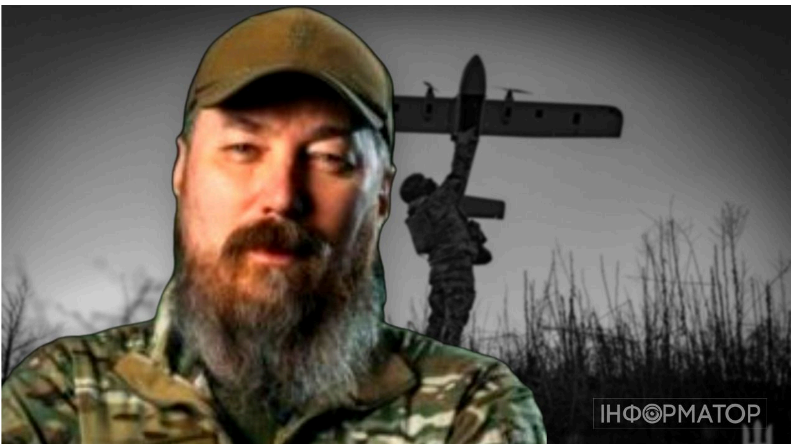
Мадяр назвав ціну ліквідації окупанта

Знешкодження одного російського окупанта безпілотником коштує менш ніж $1000 на обладнання - таку цифру назвав командувач Сил безпілотних систем ЗСУ Роберт Бровді "Мадяр". Саме сьогодні, 11 червня, Україна вперше відзначає День Сил безпілотних систем, і цього ж дня командувач підбив підсумки першого року роботи угруповання. За цей час СБС уразили понад 102 тисячі окупантів - кожен третій ворог, знищений у цій війні, припадає на рахунок дронів. Мадяр наполягає: пластик і метал дрону - найвигідніший обмінний курс у сучасній війні.